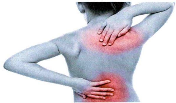
DOLORI ALLA COLONNA E SCOLIOSI