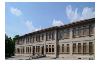
Fara Gera d'Adda